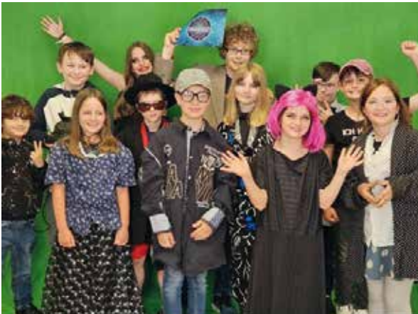
Gruppe der diesjährigen Ferienspaßaktion

Zwölf Kinder drehten unter der Leitung der Theatergruppe ein "Wer wird Millionär Promi Spezial". Der Greenscreen wurde im Rathaussaal ausgeleuchtet, um die verkleideten und geschminkten Kinder als Prominente richtig in Szene zu setzen. Die Moderationskunst des jungen Moderators verblüffte das Team der Theatergruppe.