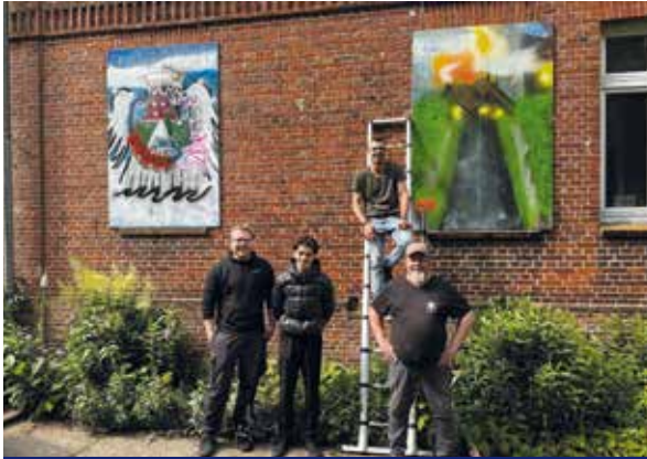
Künstler und Helfer vor dem Kunstwerk