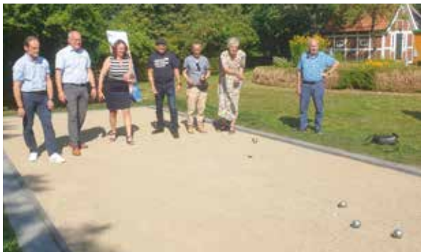
Neue Boule-Bahn in Hemmoor

Bei der Kulturziele in Hemmoor wurde eine Boule-Bahn gebaut.