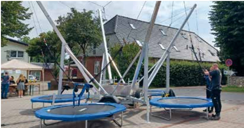
Abschlussfest der Ferienspaß-Saison 2024

Noch voller Begeisterung blicken wir auf ein wundervolles Abschlussfest der Ferienspaß-Saison 2024 zurück. Am letzten Ferientag lud die Samtgemeinde Hemmoor gemeinsam mit dem Paritätischen Hemmoor und dem Angelsportverein Hemmoor alle Kinder und Jugendlichen zum traditionellen Kinderfest ein.