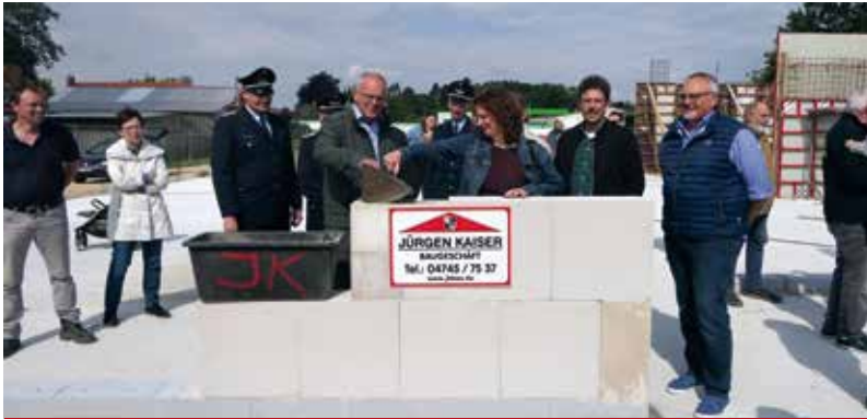
Eine Zeitkapsel wurde im Mauerwerk versunken

Die Feuerwehren Althemmoor und Westersode bekommen ein gemeinsames Feuerwehrhaus, welches knapp in der Mitte der beiden vorherigen liegt. Beide Wehren behalten aber ihre Selbstständigkeit.