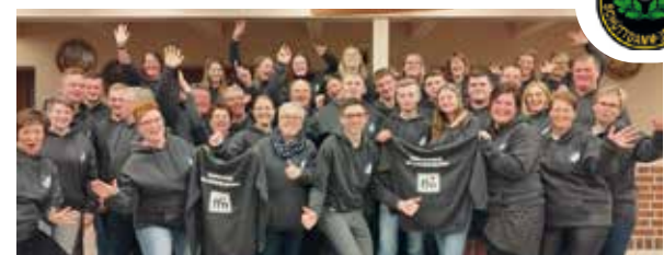
Aus dem Projekt "ffn-VerEinkleiden" des Radiosenders FFN gewann der Spielmannzug Isensee für die kalte Jahreszeit neue Hoodies

Gleich zweimal wurde der Spielmannszug Schüttdamm-Isensee in diesem Jahr ausgestattet - erst mit Hoodies und dann noch mit Poloshirts.