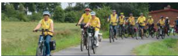
Mitglieder des Radsportvereins auf Tour

Ein Highlight im Veranstaltungskalender des Radsportvereins Hemmoor ist das alljährliche Sommerfest. Über 30 Gäste begannen dieses Fest bei hochsommerlichen Temperaturen mit einer gemeinsamen Fahrradtour. In Oberndorf wurde Kaffee und Kuchen aufgetischt und in der Wingst wurde das Waldmuseum besichtigt. Den Ausklang bildete dann das Treffen mit den Nichtradlern in der Kulturdiele Hemmoor mit Essen, Trinken und vielen Gesprächen.