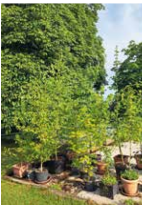
Bäume für das Einheitsbuddeln

Die Kirchengemeinde St-Marien Hechthausen beteiligt sich für die ev. Jugend Land Hadeln am "Einheitsbuddeln" und ruft zum Mitmachen auf. Einheitsbuddeln?!