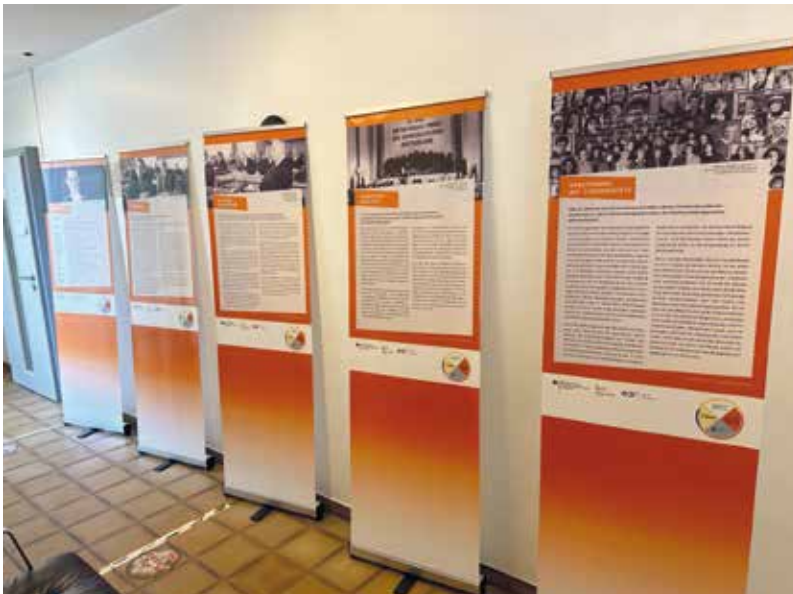
Ausstellung „Mütter des Grundgesetzes“

Freitag, den 24. Mai 2024, eine Ausstellung bestehend aus 17 Roll-Up Plakaten. Gezeigt wurden bei der Ausstellung "Die Mütter des Grundgesetzes" Lebensbilder der Politikerinnen Frieda Nadig, Elisabeth Selbert, Helene Weber und Helene Wessel. Sie haben als Mitglieder des Parlamentarischen Rates wesentlich zum Entstehen des Grundgesetzes und zu der verfassungsrechtlichen Gleichstellung von Frauen und Männern beigetragen. Die Ausstellung "Die Mütter des Grundgesetzes" ist ein Angebot des Helene Weber Kollegs und wird vom Bundesministerium für Familie, Senioren, Frauen und Jugend gefördert. Informationen finden Sie unter www.frauenmachenpolitik.de .