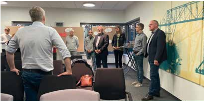
Auftaktveranstaltung - Kommunale Wärmeplanung

Die gesetzten Klimaschutzziele der Bundesregierung stellen für die Gesellschaft eine große Herausforderung dar. Das aktuell auf Bundesebene diskutierte Heizungsgesetz sowie die Verpflichtung für Kommunen, sich mit der strategischen Wärmeplanung auseinanderzusetzen zu müssen, wirft Fragen zur zukünftigen Wärmeversorgung aller Gebäude und bezahlbarer Energie auf. Für die Samtgemeinde Hemmoor wird nun eine kommunale Wärmeplanung entwickelt. Hiermit soll den Bürger:innen Klarheit über Optionen zur zukünftigen Wärmeversorgung gegeben werden. Für die Samtgemeinde