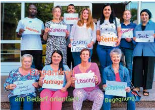
Gemeinwesenarbeit des Paritätischen KV Cuxhaven