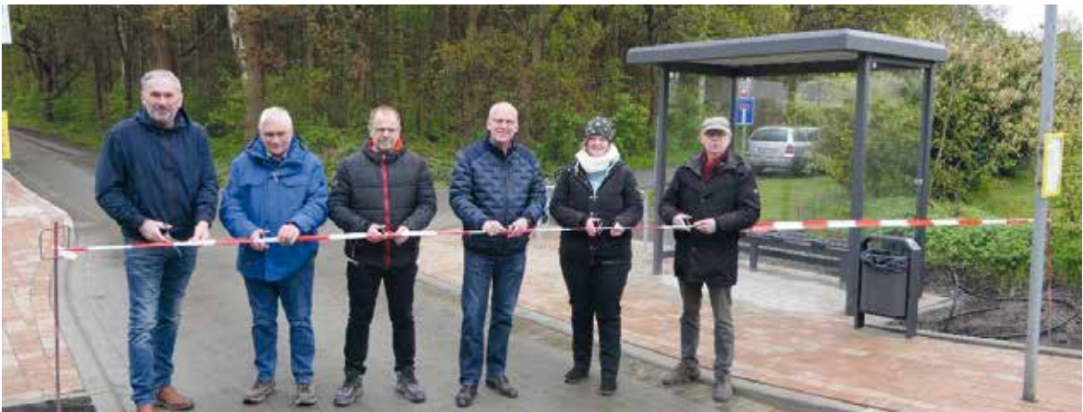
Einweihung der sanierten Bushaltestelle

Die Haltestellen Heideweg Nord und Süd in der Straße "Hinterm Holz" wurden saniert. Maßgeblich hierfür war das erhöhte Aufkommen als Einstiegshaltestelle, das die Notwendigkeit für einen barrierefreien Ausbau erfordert. Aufgrund der beengten öffentlichen Platzverhältnisse und dem angrenzenden Wald, ist eine Verschiebung der Haltestelle in westlicher Richtung und eine Umplanung der Fahrbahn notwendig gewesen. Durch neue Hoch- und Tiefpunkte in der Straße "Hinterm Holz" in Kombination mit einer Randeinfassung als Verlängerung der Busbordsteine und Wasserläufe, ist eine geregelte Entwässerung der öffentlichen Flächen entstanden. Eine neue Aufstellfläche sorgt nun für mehr Sicherheit der wartenden Fahrgäste und neue Busbordsteine erleichtern das Anfahren der Niederflrbusse. Farblich wird der Aufstellbereich von der restlichen Haltestelle hervorgehoben. Es