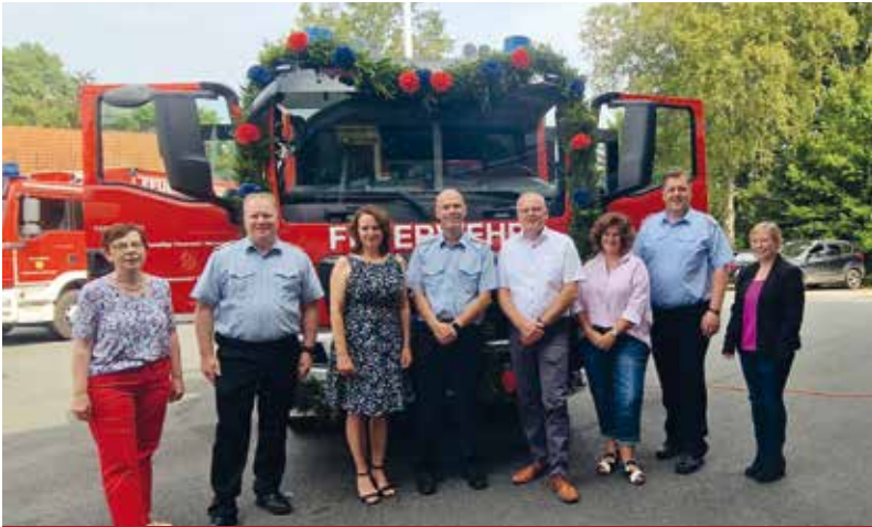
Übergabe des neuen Löschgruppenfahrzeuges

Bei der Feuerwehr Warstade gab es Anfang August etwas zu feiern. Ein neues Löschgruppenfahrzeug (LF 10) wurde an die Wehr übergeben.