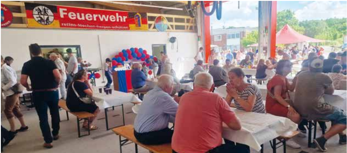
Tag der offenen Tür bei der Freiwilligen Feuerwehr Hechthausen

Am Mittwoch, den 08. Mai 2024, wurde das neue Feuerwehrhaus Hechthausen in der Löhberger Straße eröffnet.