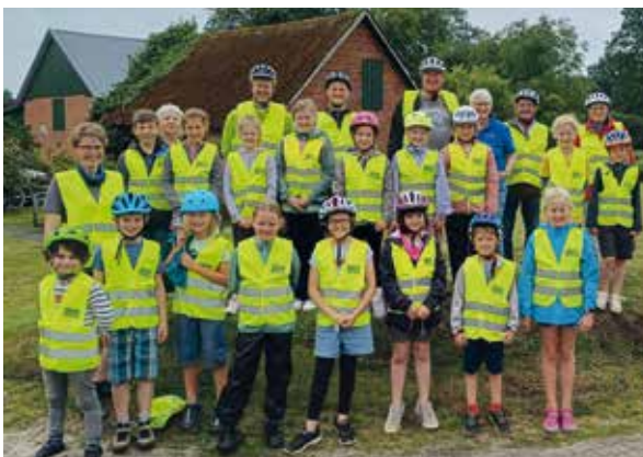
Teilnehmer der Ferienpaßaktion

Im Rahmen der Ferienpaßaktion der Samtgemeinde Hemmoor organisierte die Verkehrswacht Am Dobrock-Hemmoor eine Fahrradtour für 17 Kinder im Alter von 6 bis 10 Jahren. Die Tour führte die jungen Radler von Hemmoor bis in die Wingst und zurück, wobei der Start- und Zielpunkt der Rathausplatz in Hemmoor war.